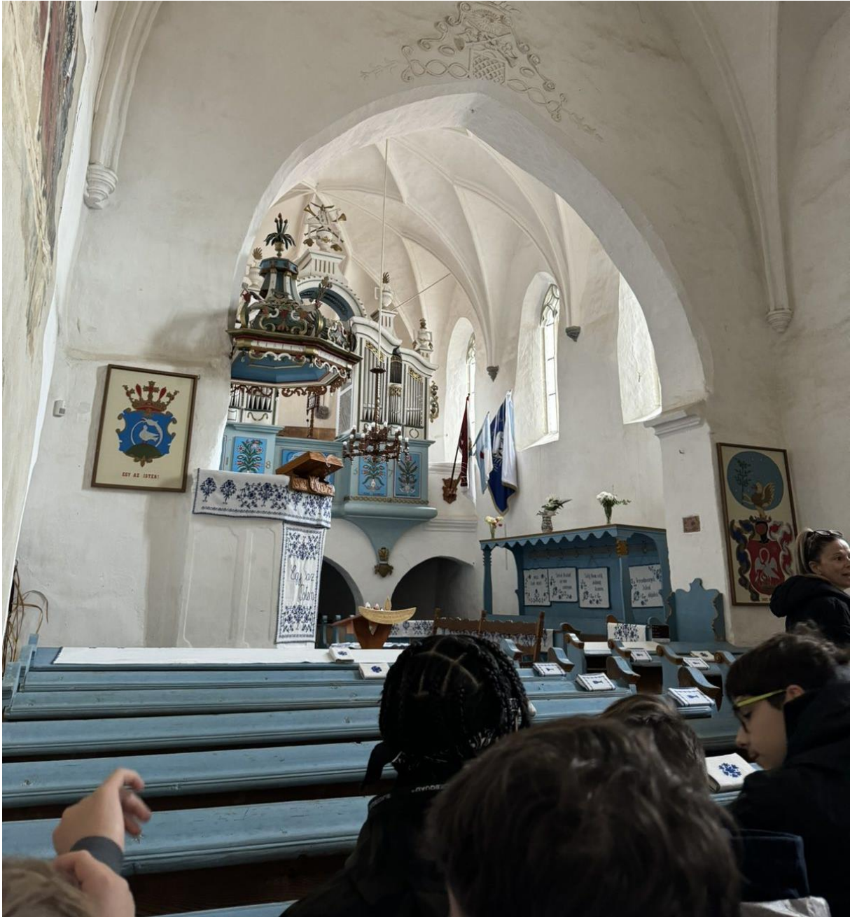
a székelyderzsi unitárius templomban

Csütörtökön a reggeli után egy rövid buszútra indultunk, hogy meg tudjuk látogatni a Székelyderzsen található unitárius templomot. Ezután ellátogattunk Fehéregyházára a Petőfi emlékmúzeumba, ahol betekintést nyerhettünk a Segesvári csata eseményeibe. Az ebédünk egy-egy lángos volt, amit Kőrispatakon fogyasztottunk el, ahol megtekintettük a szalmakészítés menetét, a gyerekek pedig ki is próbálhatták a szalmafeldolgozás lépéseit. Vacsora után pedig részt vettünk a korondi művelődési házban megtartott folklóresten, melynek végén együtt elénekeltük a Nélküled című dalt.