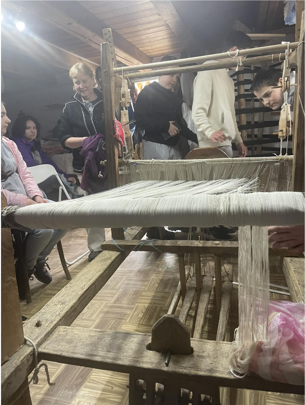
ismerkedés a szövészettel