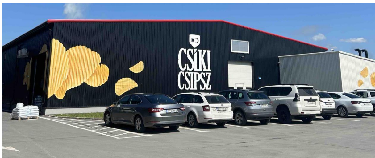
a Csíki csipsz-gyár

Péntek reggelre sajnos három tanuló rosszul lett, ők már éjjel sem voltak jól, valószínű, hogy elrontották a gyomrukat a sok olajban sült ételtől, amit előző nap ettek. Én a szálláson maradtam velük, az osztály többi része meglátogatta az 1000 éves határt, a Mária-kegyhelyet, valamint a Csíki Chips gyárat.